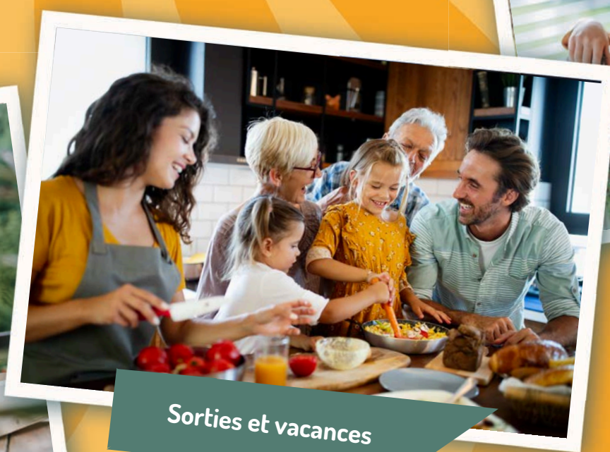
Sorties et vacances