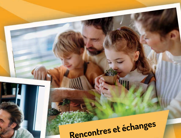
Rencontres et échanges